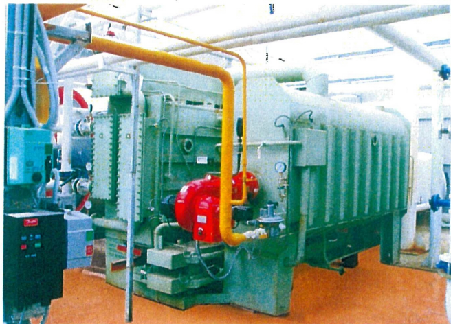
Теплонасосная установка мощностью 7000 кВт. Тепличный комбинат, Краснодарский край