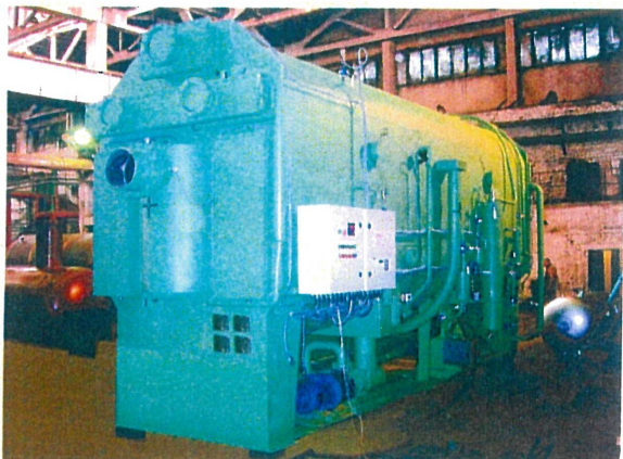
Холодильная машина мощностью 3000 кВт