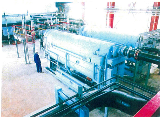
Холодильная станция мощностью 3500 кВт. ОАО «Тулачермет»

Институт теплофизики СО РАН, Россия, 630090 г. Новосибирск, просп. Акад. Лаврентьева, 1 Тел./факс: (383) 333-10-97 Тел.: (383) 330-75-60, 339-10-43 E-mail: popov@itp.nsc.ru